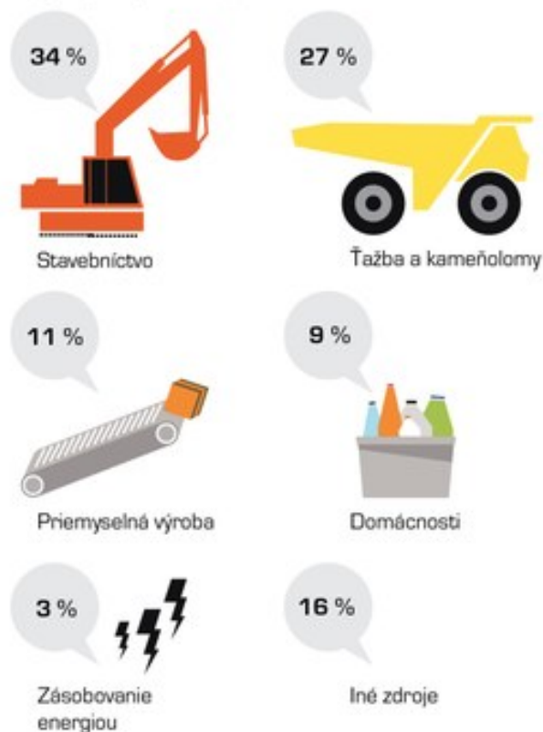
Toky odpadov podľa zdroja