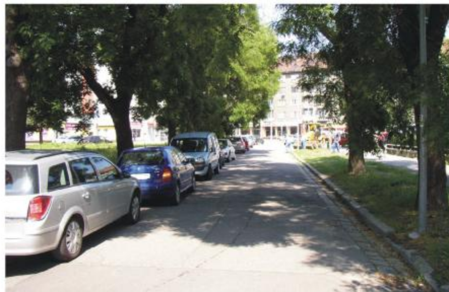
Obr.č.3: Pohľad na Kvačalovu ulicu v súbehu so západnou hranicou dotknutého územia