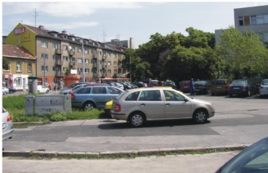
Obr.č.1: Pohľad na existujúce parkovisko s nepostačujúcou kapacitou v SZ časti dotknutej plochy