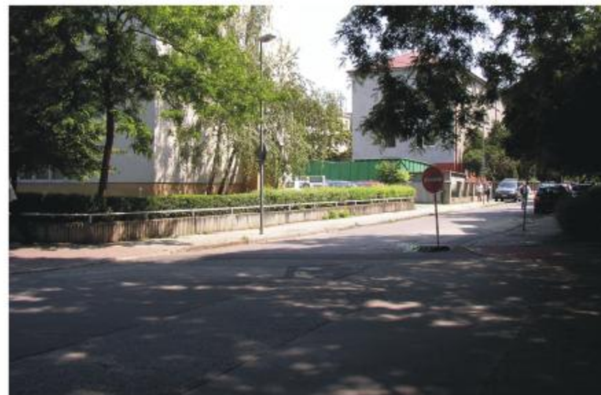
Obr.č.4: Pohľad na navrhované miesto vjazdu / výjazdu do podzemnej garáže - Kocel'ova ulica