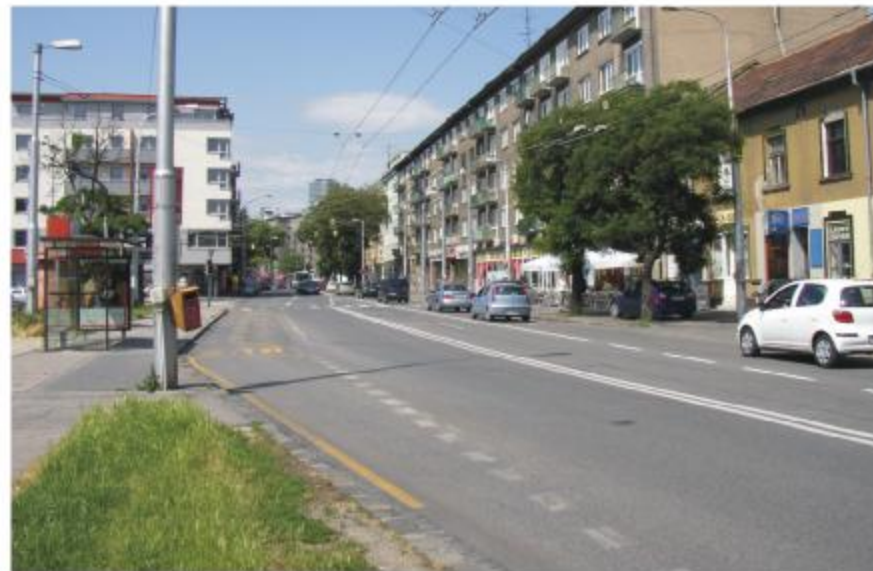
Obr.č.2: Pohľad na Záhradnícku ulicu, v dotyku so severnou časťou dotknutého územia