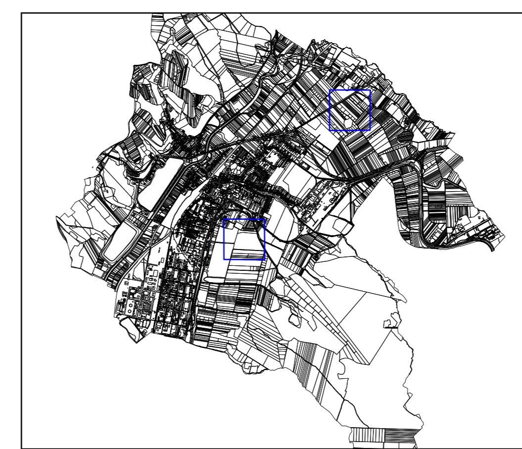
VÝREZY VÝKRESU ZMENY A DOPLNKY Č. 2