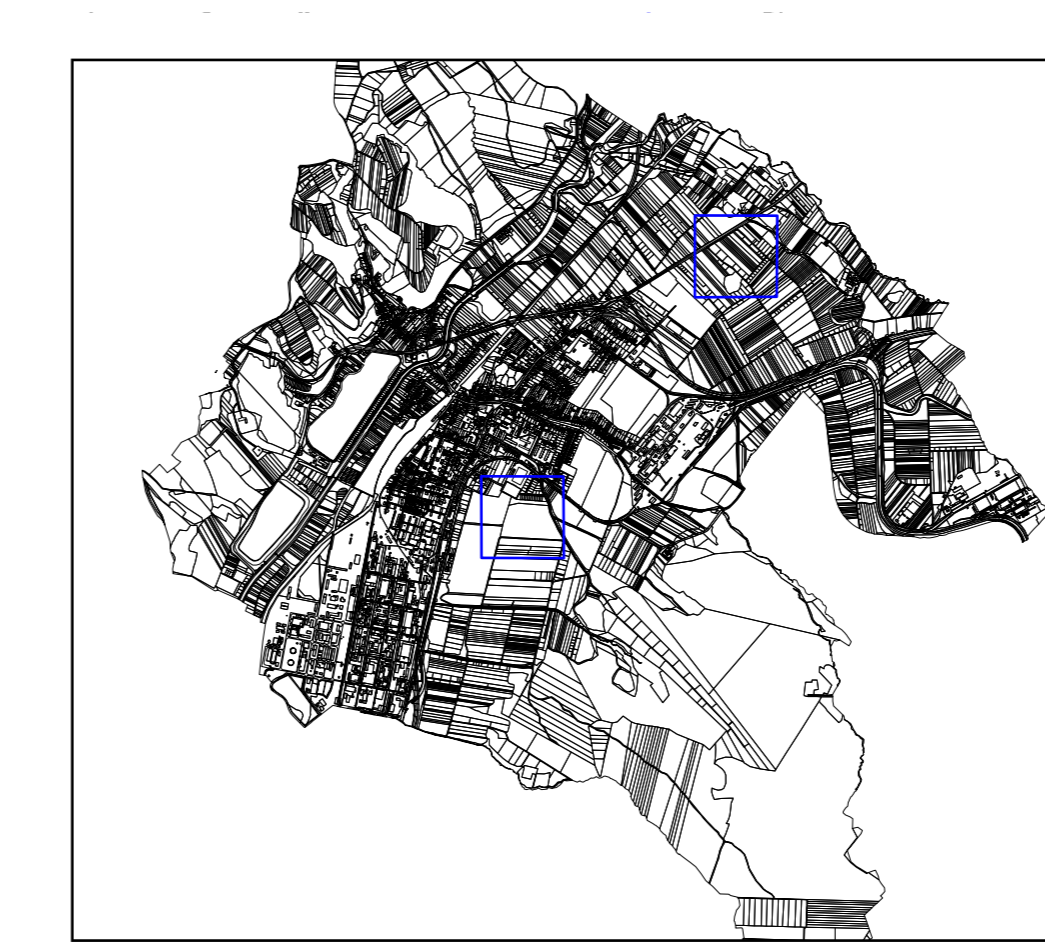
VÝREZ VÝKRESU ZMENY A DOPLNKY Č. 2