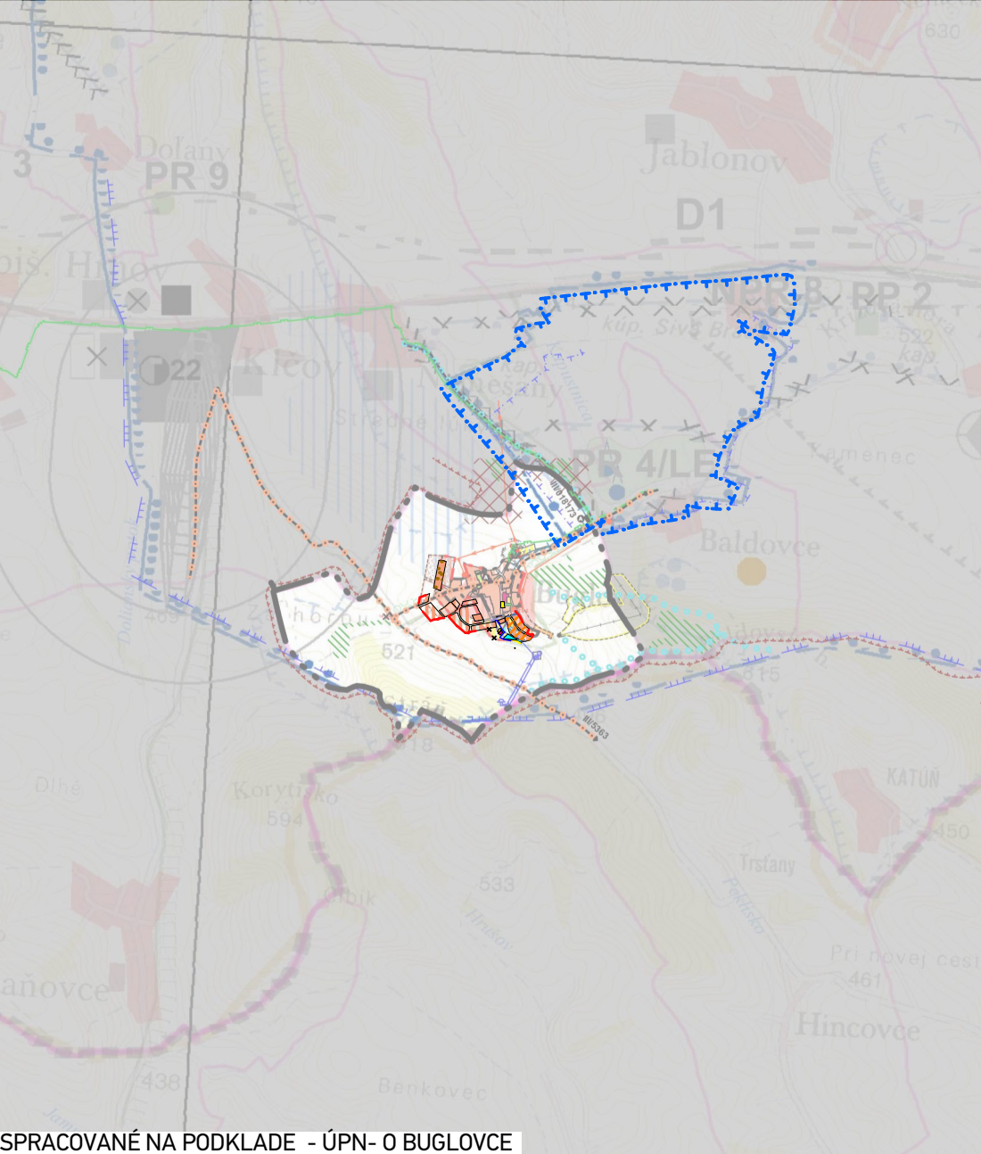
SPRACOVANÉ NA PODKLADE - ÚPN - O BUGLOVCE