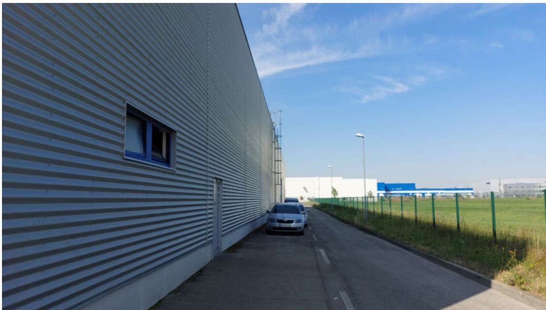
Obr.3: Pohľad na objekt existujúcej prevádzky, ku ktorému bude pristavané rozšírenie