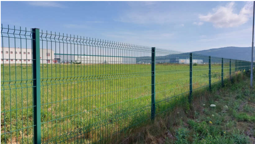
Obr.2: Pohľad na SV časť pozemku na ktorom dôjde k rozšíreniu navrhovanej prevádzky