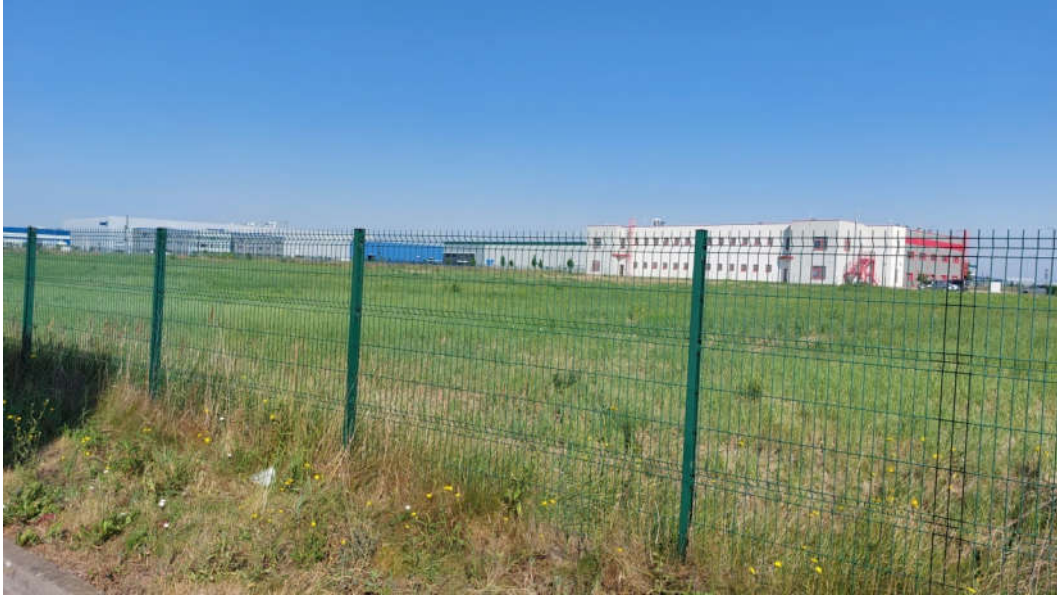
Obr.1: Pohľad na SZ časť pozemku na ktorom dôjde k rozšíreniu navrhovanej prevádzky