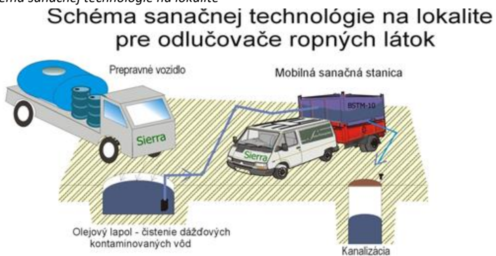
Obrázok č.2: Schéma sanačnej technológie na lokalite