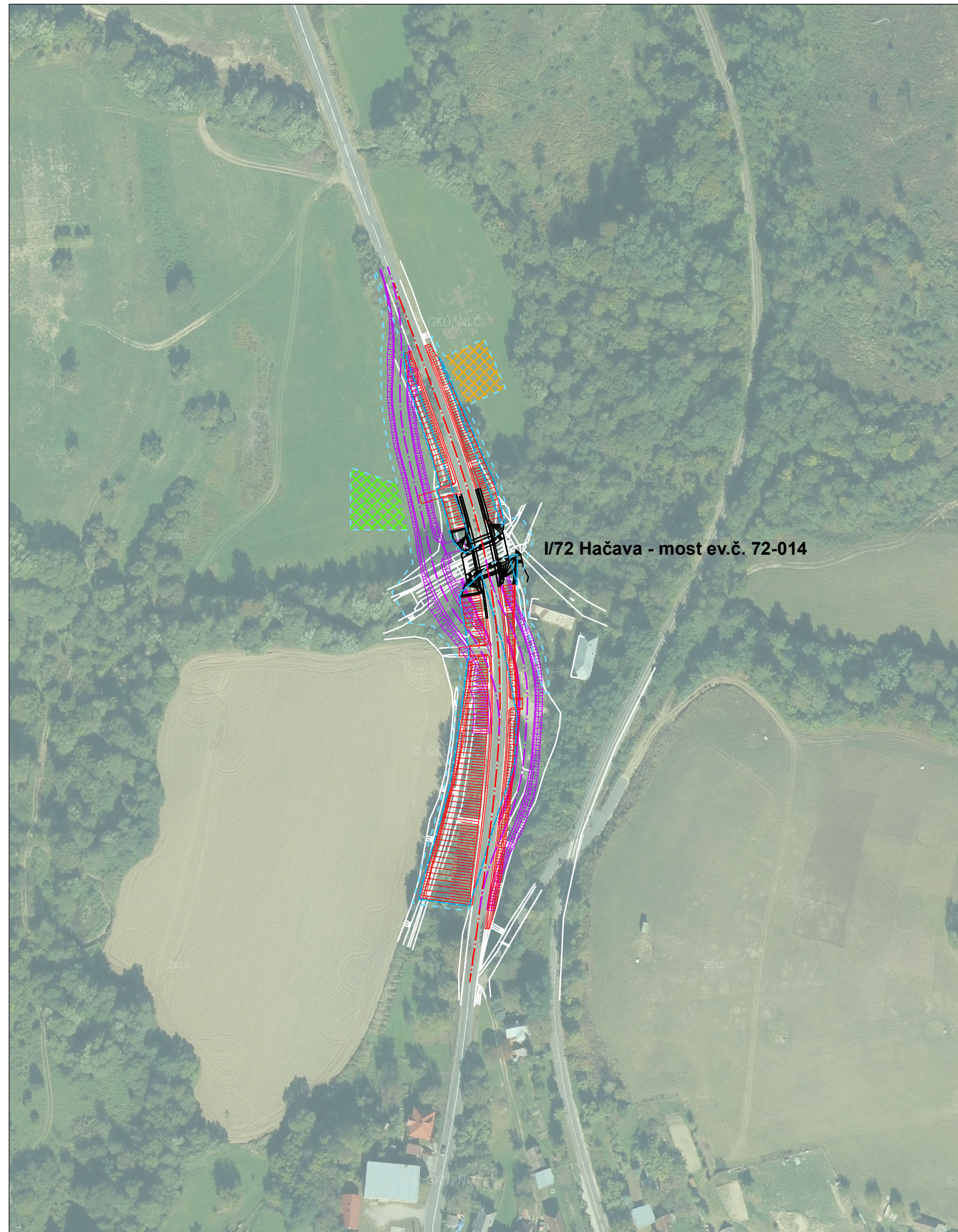
I/72 Hačava - most ev.č. 72-014

Oznámenie o zmene navrhovanej činnosti podľa prílohy 8a zákona č. 24/2006 Z. z. o posudzovaní vplyvov na životné prostredie a o zmene a doplnení niektorých zákonov