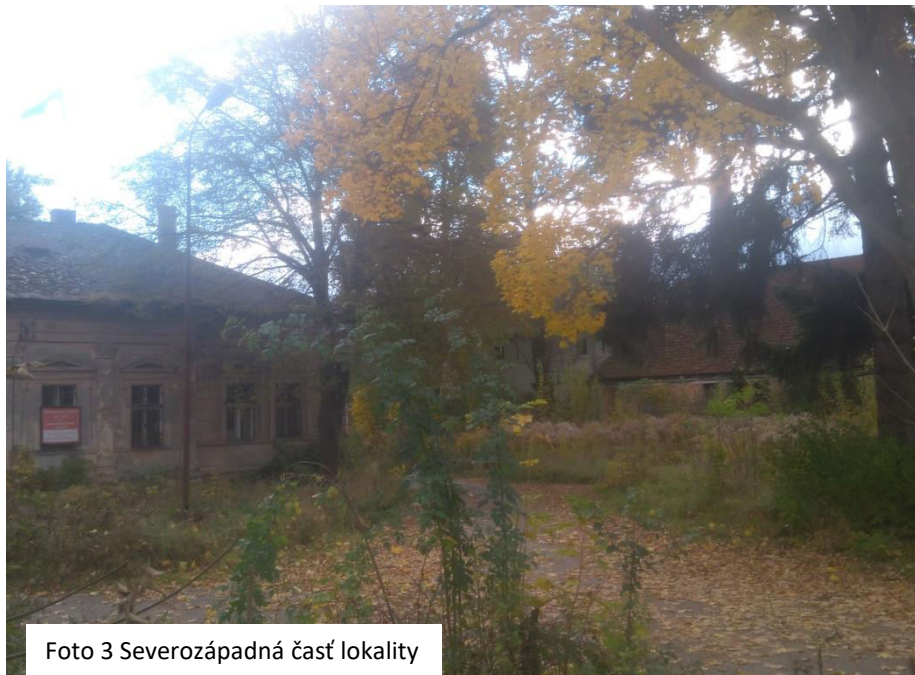
Foto 3 Severozápadná časť lokality