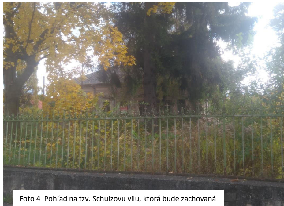
Foto 4 Pohľad na tzv. Schulzovu vilu, ktorá bude zachovaná