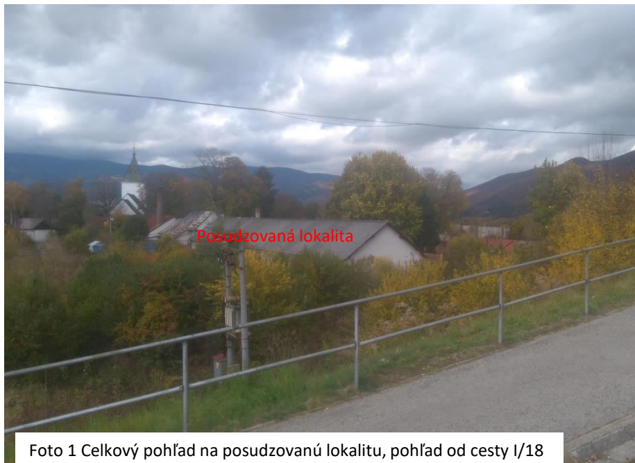
Foto 1 Celkový pohľad na posudzovanú lokalitu, pohľad od cesty I/18