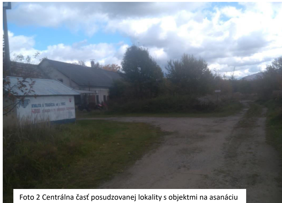
Foto 2 Centrálna časť posudzovanej lokality s objektmi na asanáciu