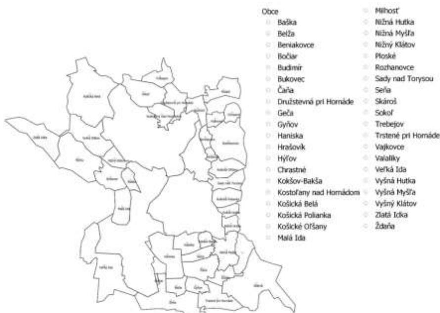
Obrázok 3 Mesto Košice a jeho funkčná oblasť

K obciam zaradeným do funkčnej oblasti mesta patria obce: Baška, Belža, Beniakovce, Bočiar, Budimír, Bukovec, Čaňa, Družstevná pri Hornáde, Geča, Gyňov, Haniska, Hrašovík, Hýľov, Chrastné, Kokšov-Bakša, Kostofany nad Hornádom, Košická Belá, Košická Polianka, Košické Oľšany, Malá Ida, Milhošť, Nižná Hutka, Nižná Myšľa, Nižný Klátov, Ploské, Rozhanovce, Sady nad Torysou, Seňa, Skároš, Sokol, Trebejov, Trstené pri Hornáde, Vajkovce, Valaliky, Veľká Ida, Vyšná Hutka, Vyšná Myšľa, Vyšný Klátov, Zlatá Idka, Ždaňa. Administratívne patria do okresu Košice – okolie.