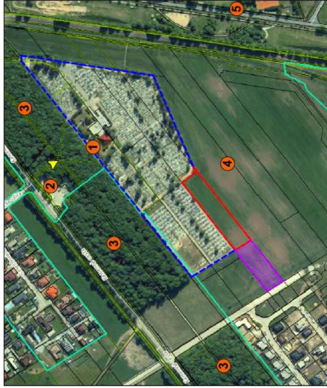
ortofoto M : 1 : 4000