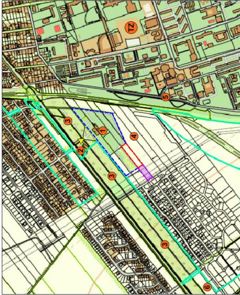
M : 1 : 7500