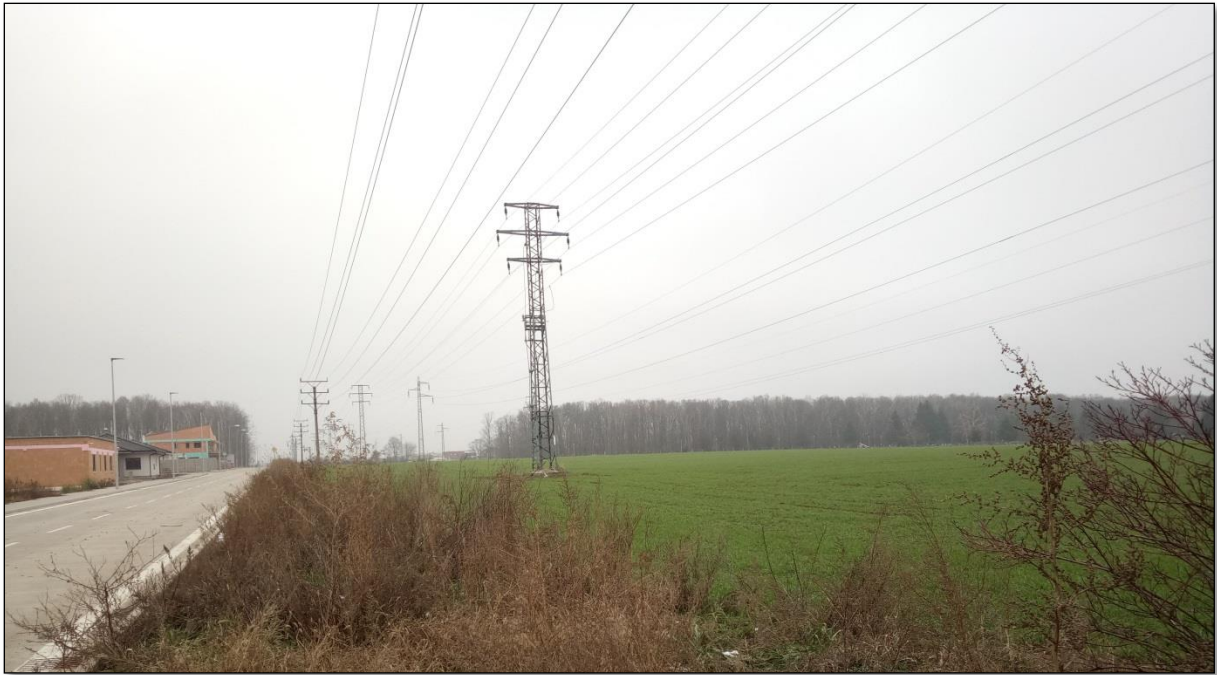
Obr.5: Pohľad na hodnotenú lokalitu z juhu - vedenie VVN prechádza cez plochu na uloženie skrývky a vľavo výstavba RD v obytnej zóne Kamenný mlyn.