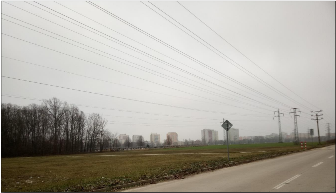
Obr.3 :Pohľad na hodnotenú lokalitu od severozápadu - vľavo miestny biokoridor MBk Lesopark.

Obr.4: Pohľad na hodnotenú lokalitu od západu - v popredí jestvujúca komunikácia k obytnej zóne Kamenný mlyn, pod vedením VVN plánovaná plocha určená na uloženie skrývky, na ktorej sa následne vybuduje parkovisko.