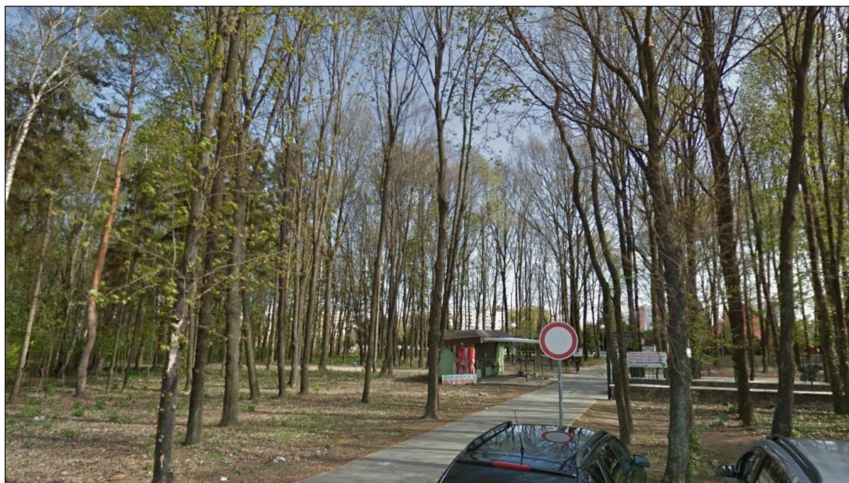
Obr.2: Vstup do jestvujúceho cintorína na Kamennej ceste