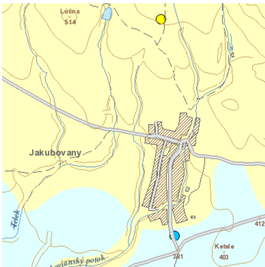
Obr. Radónové riziko evidované v k.ú. Jakobovany

Katastrálne územie obce spadá do nízkeho až stredného radónového rizika. Stredné radónové riziko môže negatívne ovplyvniť možnosti ďalšieho využitia územia. Vhodnosť a podmienky stavebného využitia územia spadajúceho do stredného radónového rizika je potrebné posúdiť podľa zákona č. 355/2007 Z.z. o ochrane, podpore a rozvoji verejného zdravia a vyhl. MZ SR č. 528/2007 Z.z., ktorou sa ustanovujú podrobnosti o požiadavkách na obmedzenie ožiarenia z prírodného žiarenia.