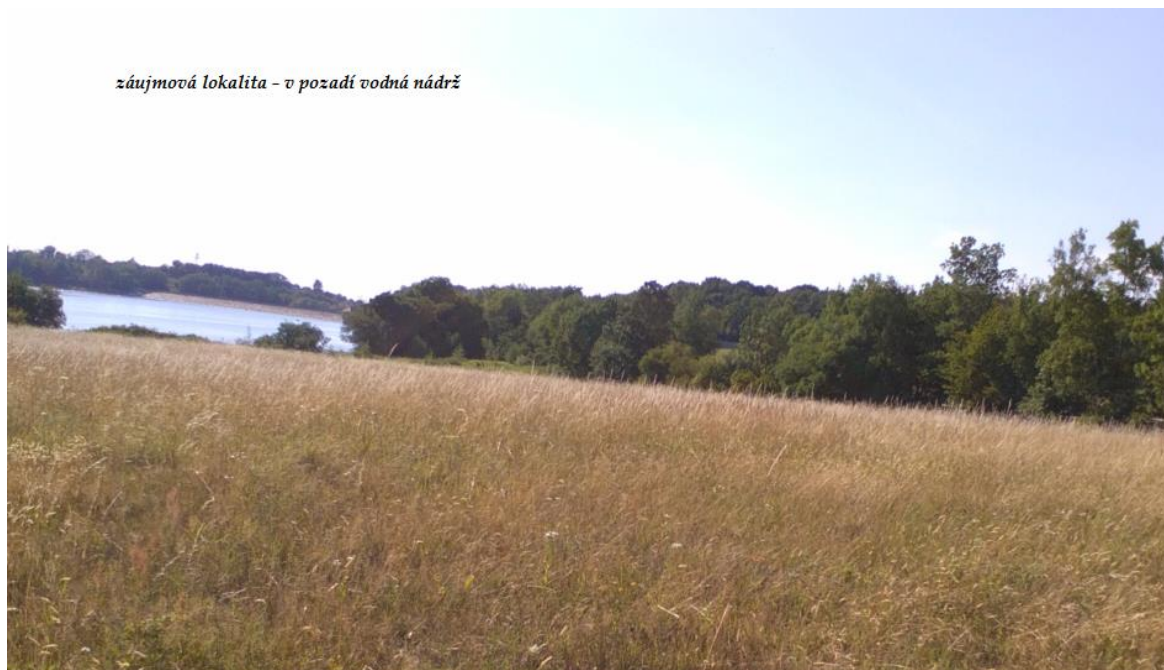
záujmová lokalita - v pozadí vodná nádrž