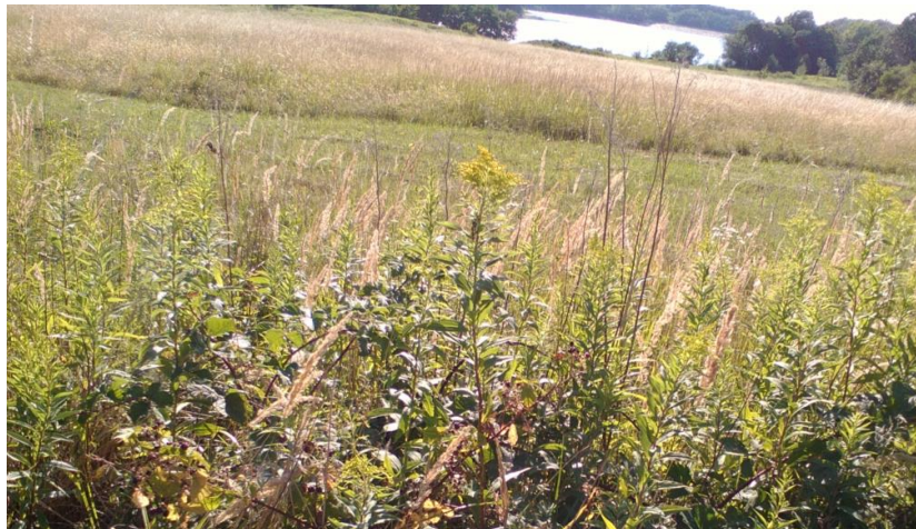
Pozemky blízko vodnej nádrže: