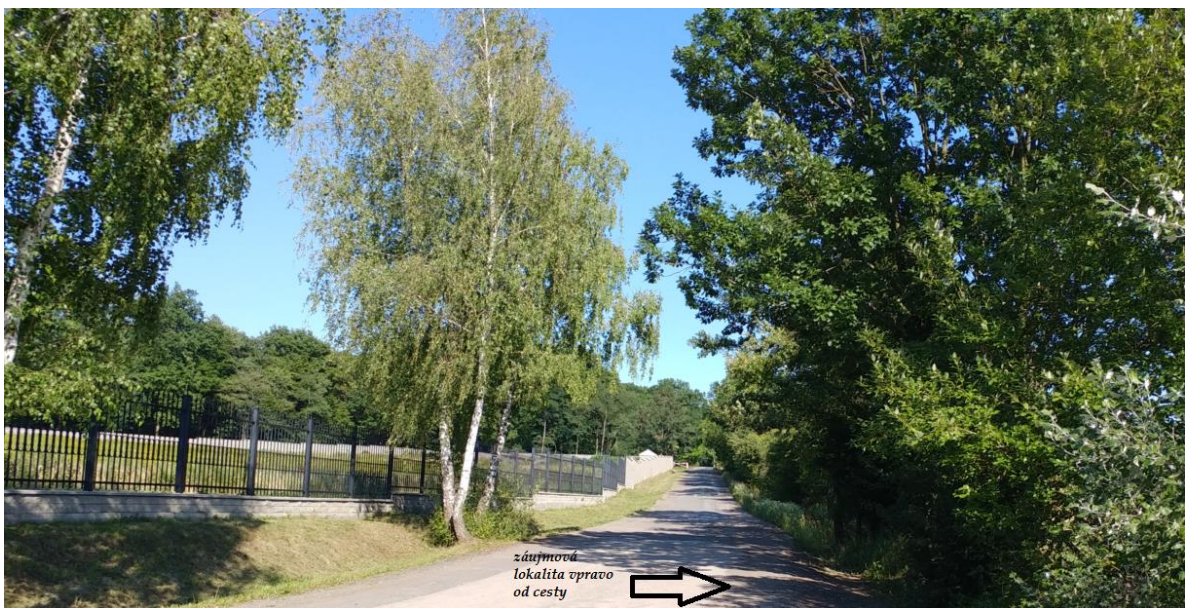
zájmová lokalita za cestou - južne ↗