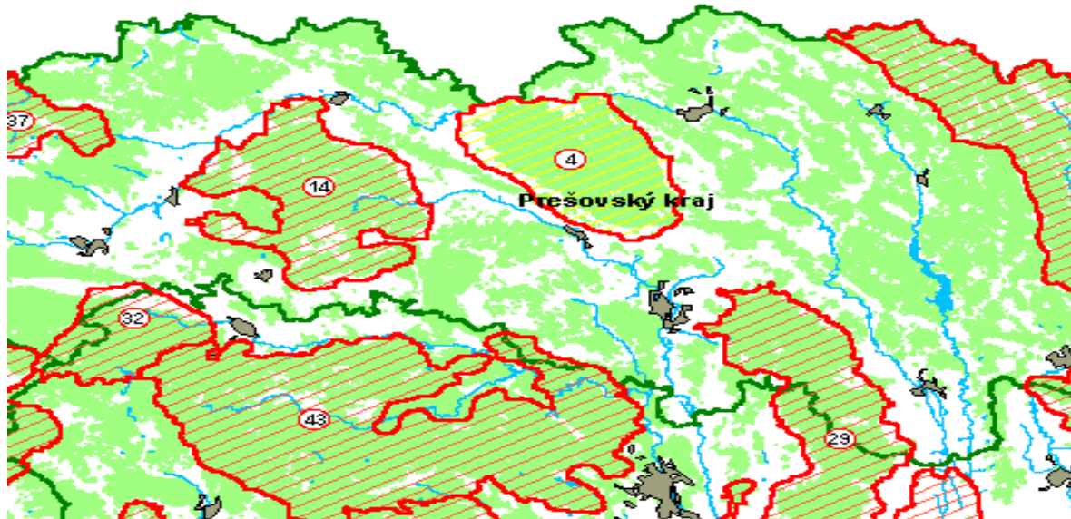
Obrázok 3 Mapa CHVÚ Čergov

Územie európskeho významu Čergov – rozloha 6063,43 ha. V ÚEV Čergov sú predmetom ochrany biotopy a chránené druhy.