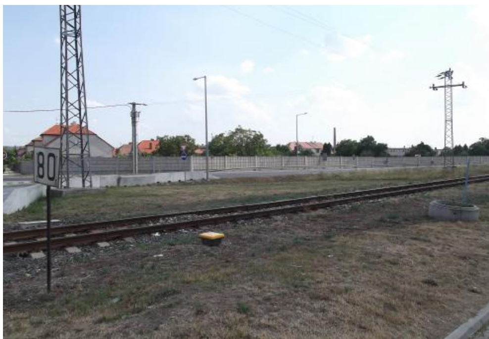
Obr.: Protihluková stena pozdĺž komunikácie II/426 na Železničnej ulici

Najbližšie trvalo obývané územie – domová zástavba sa nachádza od plochy riešeného územia cca 440 m v južnom smere má vybudovanú protihlukovú stenu, ktorá zabraňuje šíreniu hluku z dopravy na príľahlej cestnej komunikácii II/426 na Železničnej ulici a železničnej trati.