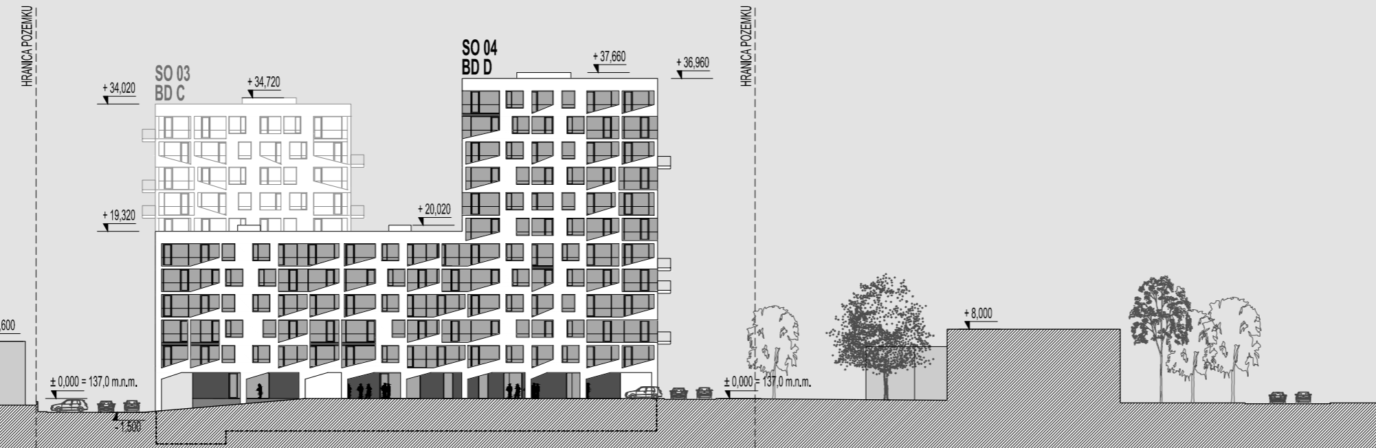
POHLAD B - JUHOZÁPADNÝ M 1:600