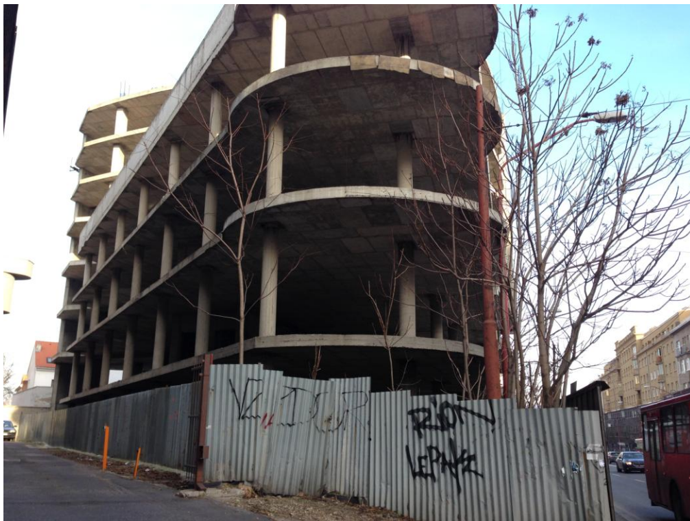
Obr. 2 Miesto realizácie navrhovanej zmeny činnosti, rozostavaná stavba polyfunkčného objektu, pohľad zo severozápadu