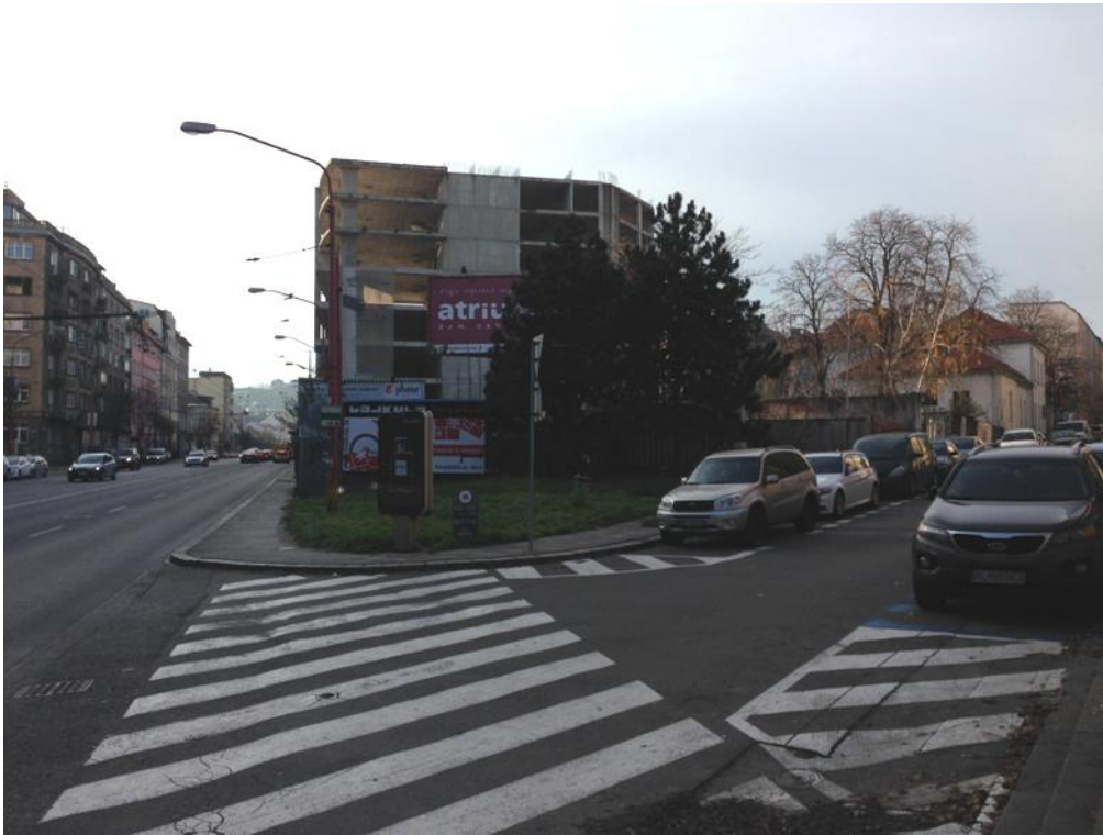
Obr. 1 Miesto realizácie navrhovanej zmeny činnosti, v pozadí rozostavaná stavba polyfunkčného objektu, pohľad z juhovýchodu