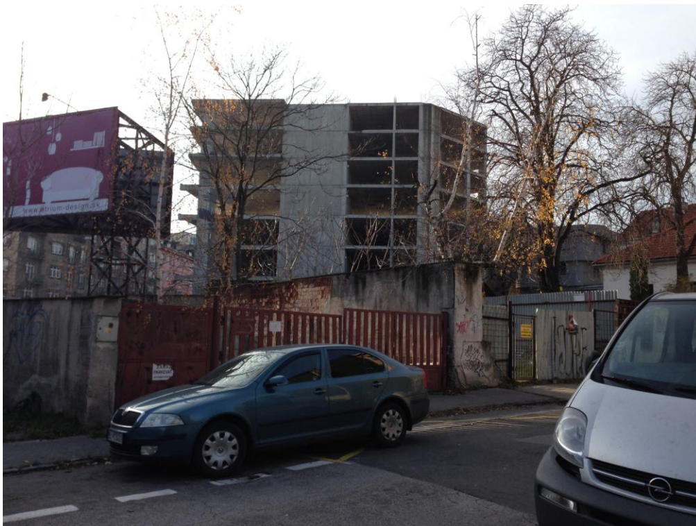
Obr. 3 Pohľad na miesto výstavby z Beskydskej ul.