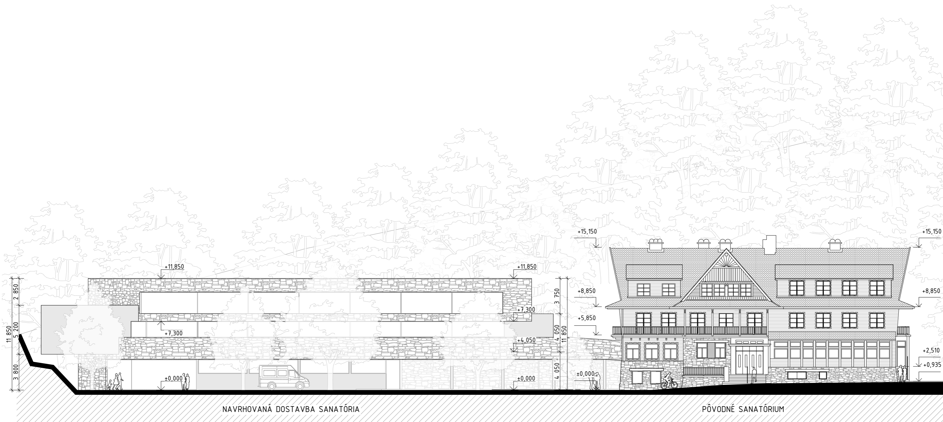
NAVRHOVANÁ DOSTAVBA SANATÓRIA