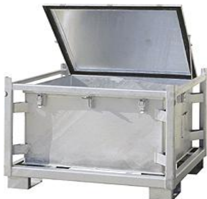
KS 500 Typ: 1255