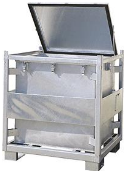
KS 800 Typ: 1258