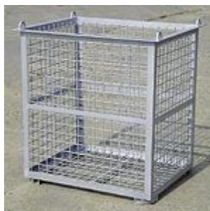
Kontajnerová vložka KS 800 Typ: 1258