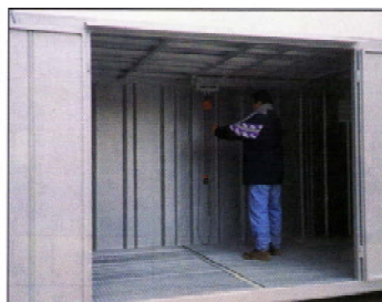
Varianta s kladkou