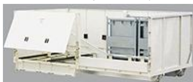
Typ: 5009 FLET - nosič kontajnerov