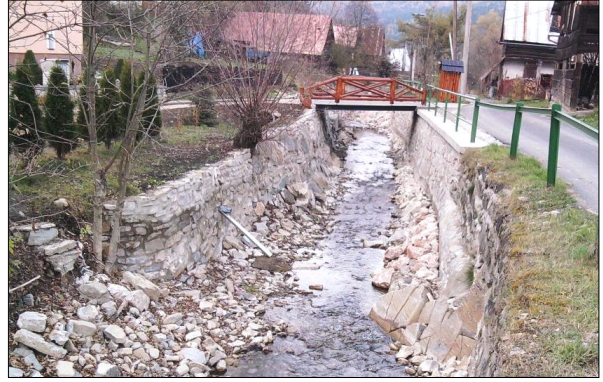
Obrázky č. 1 - 2: Na horných obrázkoch je pohľad súčasný stav riešeného úseku potoka Hraničná, kde je potrebné vybudovať pravobrežnú opornú stenu (SO – 01).