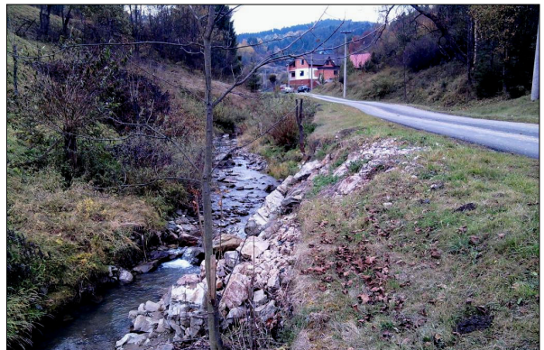
Obrázky č. 3 - 6: Na štyroch obrázkoch a na titulnej strane tejto dokumentácie je pohľad na súčasný stav 1. riešeného úseku potoka Eliašovka. Tu je potrebné vybudovať ľavobrežnú opornú stenu (SO – 02).