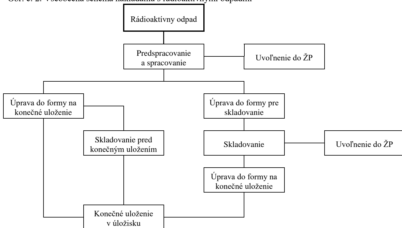
Obr. č. 2: Všeobecná schéma nakladania s rádioaktívnymi odpadmi

K tejto schéme nakladania je potrebné uviesť tri poznámky: