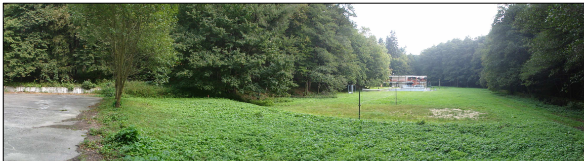
Obr.5a: Pohľad na záujmové územie južným smerom – jul 2011