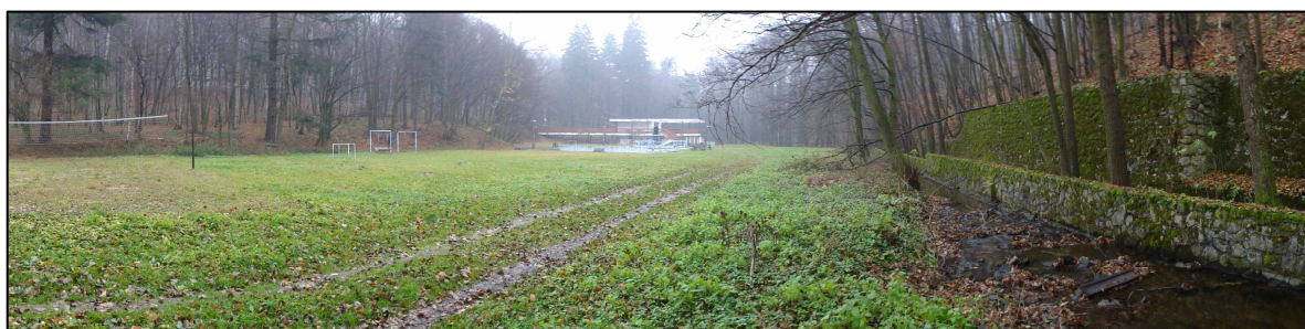
Obr.5b: Pohľad na záujmové územie južným smerom - nov.2012