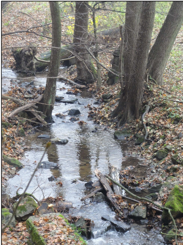
Obr.3: Pohľad na neregulovaný tok Vydrice v záujmovom území