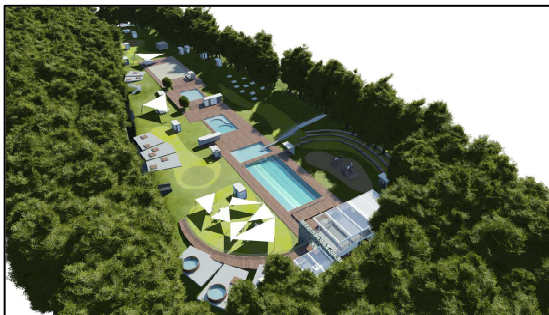
Obr.6: Komplexný pohľad na záujmové územie – vtáčia perspektíva