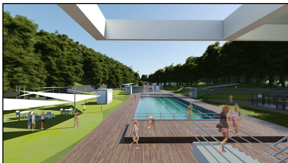
Obr.8: Pohľad na záujmové územie – severným smerom od budovy na vypočítané bazény