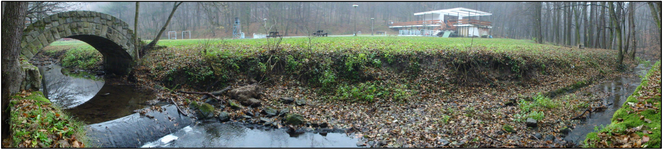
Obr.1: Pohľad na záujmové územie od toku Vydrice – východným až juhovýchodným smerom (v pozadí chátrajúci areál bývalého kúpaliska)