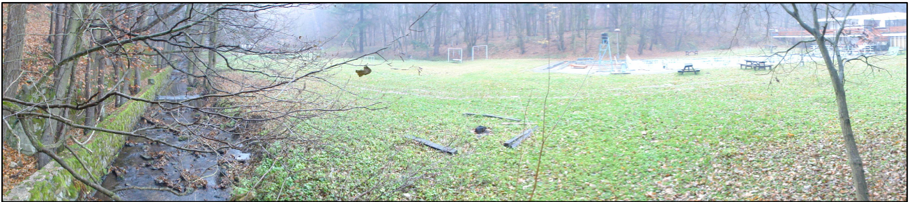
Obr.2: Pohľad na záujmové územie severovýchodným smerom