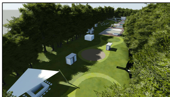
Obr.9: Pohľad na záujmové územie – južným smerom, vtáčia perspektíva