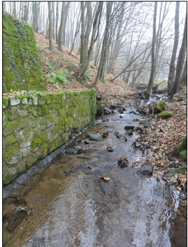
Obr.4: Pohľad na tok Vydrice - začiatok oporného múra